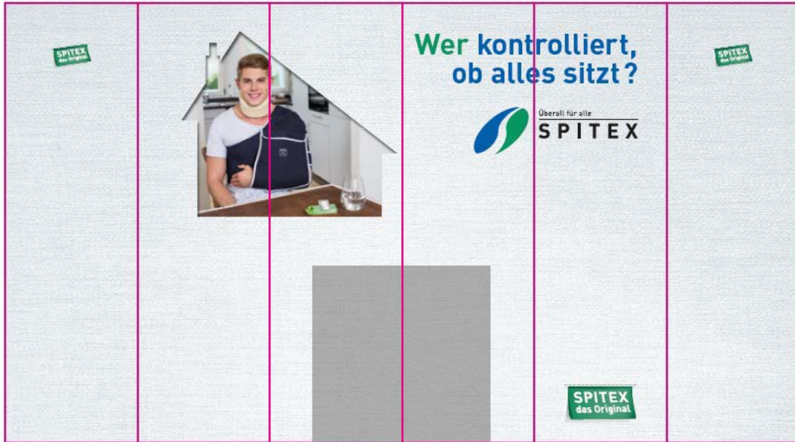
Bereich hinter Theke