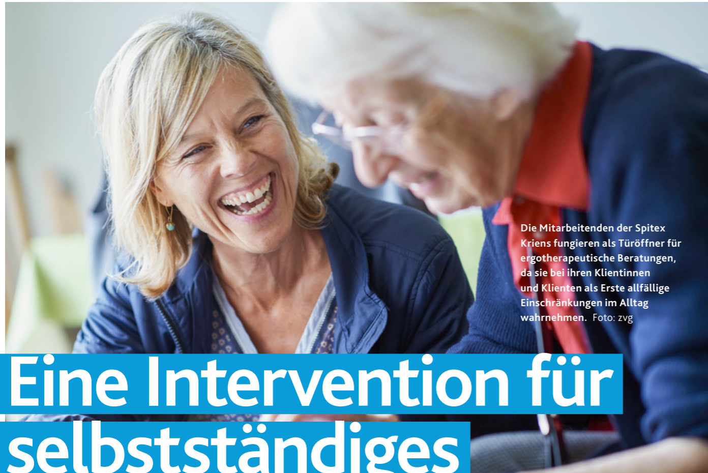
Die Mitarbeitenden der Spitex Kriens fungieren als Türöffner für ergotherapeutische Beratungen, da sie bei ihren Klientinnen und Klienten als Erste allfällige Einschränkungen im Alltag wahrnehmen.