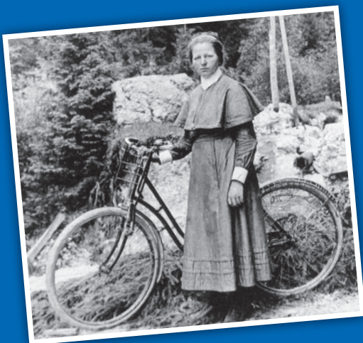
Les congrégations religieuses, comme celle des soeurs de Sainte-Anne à Lucerne, ici dans la première moitié du 20 e siècle, ont fourni un travail de pionnier